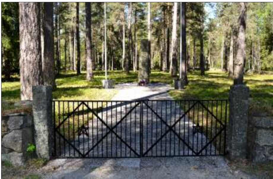
Den russiske krigskirkegården på Jørstadmoen skal rustes opp. Historielaget skal sette opp navneplater på de 954 sovjetrussiske krigsfangene som ble begravet på området.

Meningen er å ruste opp kirkegården, fjerne diverse kratt og bygge to steinmurer som skal dekkes med ti bronseplater med de 954 døde russernes navn. De ti platene vil ligge mellom porten og minnestøtta.