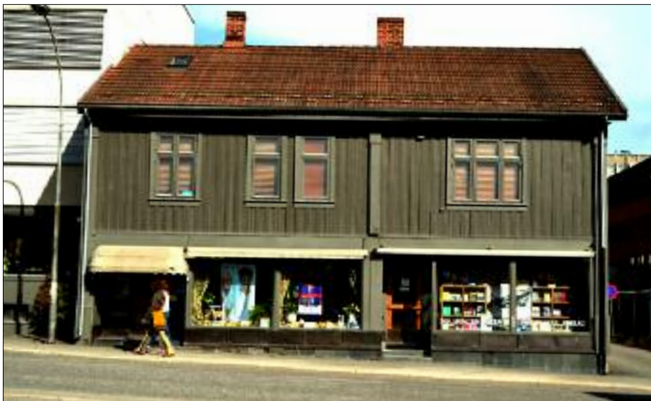
Den lokalhistoriske bokdagen i år blir lagt til Dølaringens nye lokaler i Kirkegata 51.