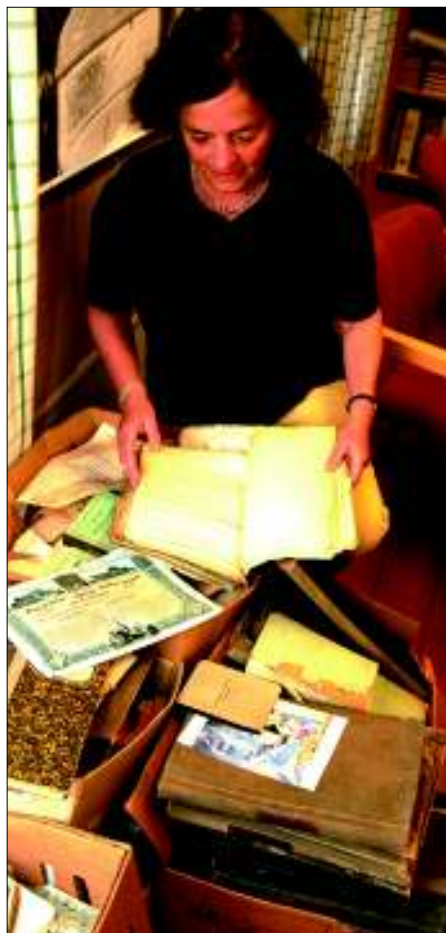
Arkivet etter Skars Renseri og Farveri er foreløpig lagret i historielagets lokaler på Maihaugen.

SVAR: Merkestein står der Maihaugbekken krysser Storgata (Storgata 3).