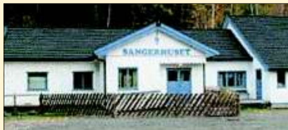
Årsmøtet i Fåberg og Lillehammer Historielag holdes på Sangerhuset ved Vingrom skole søndag 14. mars kl. 18.30.

Tre medlemmer av valgkomiteen for ett år