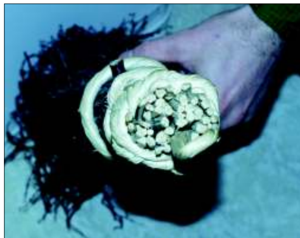
Sopelimen sett fra toppen.