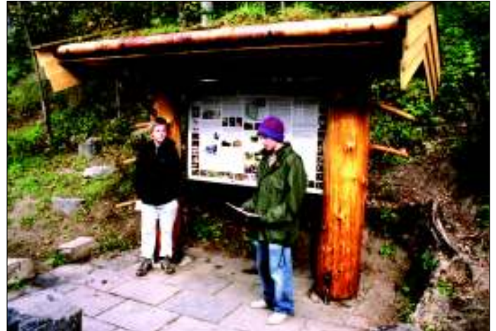
Den nye infotavla i Sundgaarden ble presentert av to Smestadelever.

Det har også blitt nevnt at dagens unge ikke vet hvorfor slike steiner er plassert langs veikanten. Kanskje en liten opplysningsplate hadde vært på sin plass?