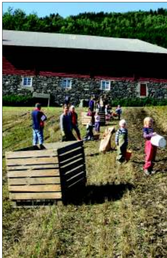
Rundt 50 personer var med på opptakingen på Hov.