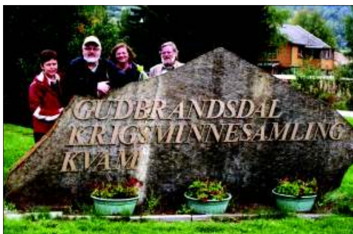
På tur til Sameti.