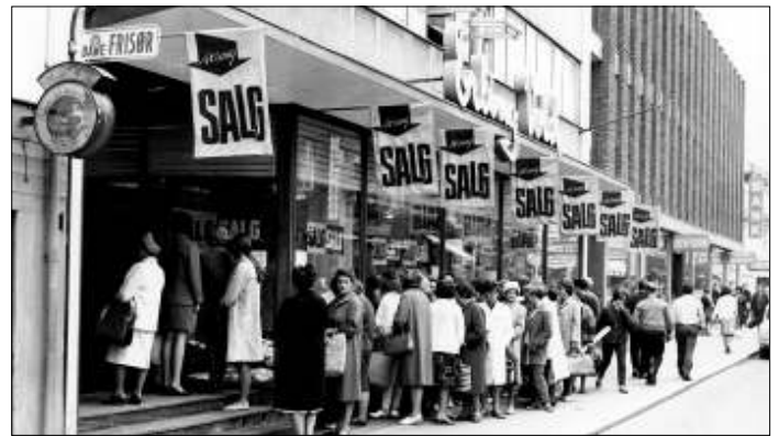
Salg hos Vold.