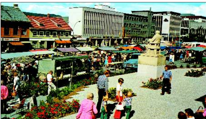
Stortorget på 60-tallet