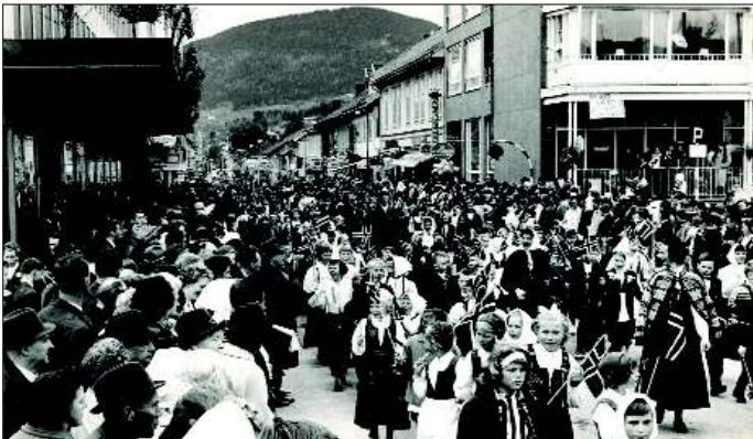
17. mai 1965.

Her er et utvalg av bildene som blir stilt ut i Notvarpet på Jorekstad.