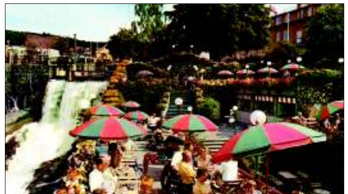
Terrassen ca. 1960