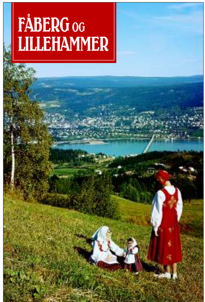
Forsidebildet på årets årbok er brukt i markedsføring av Lillehammer i 1960-årene med et motiv som viser bunadskledde jenter og Lillehammer i bakgrunnen.

Det er med andre ord ei temabok som ligger klar i bokhandlerne og som medlemmene kan kjøpe under presentasjonen i kunstmuseet til favørpris. Foruten mange artikler innenfor den valgte rammen, har også Vingrom kirkes 100 års jubileum blitt gitt plass.