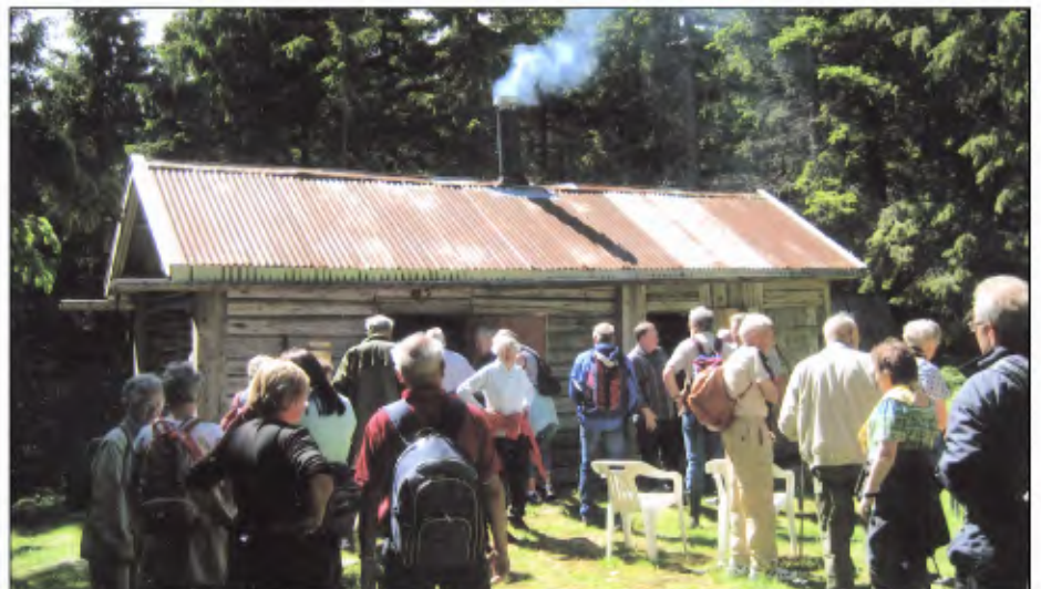
Samling på Borohytta, det som også er kalt Petterkåken.