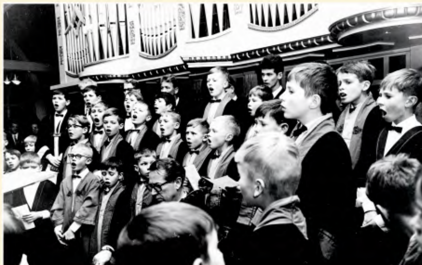
Brøgers Guttekor i Lillehammer kirke på 1950-tallet. Her er det mange kjente lillehammeringer. Vi har en del av navnene, men ikke alle. Gi oss beskjed om de du kjenner.

Se også historielagets hjemmeside, www.faaberghistorielag.no E-postadressen er kirsten.andberg@tele2.no