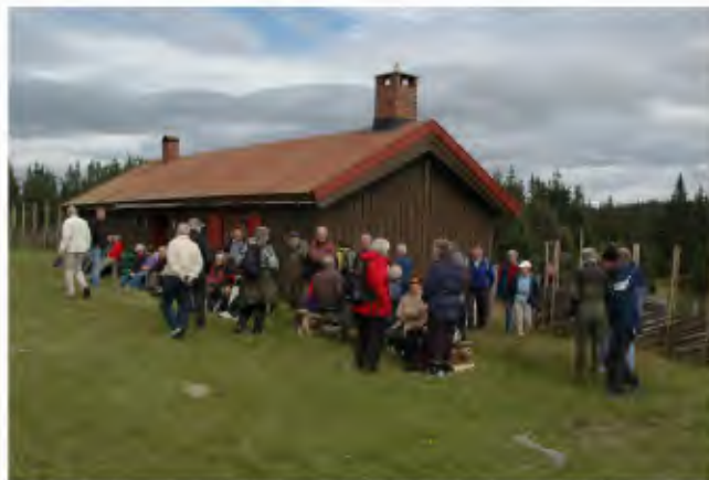
Siste stoppested var på Simenrudsetra.