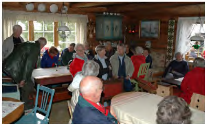
Fra størhuset på Borosetra.