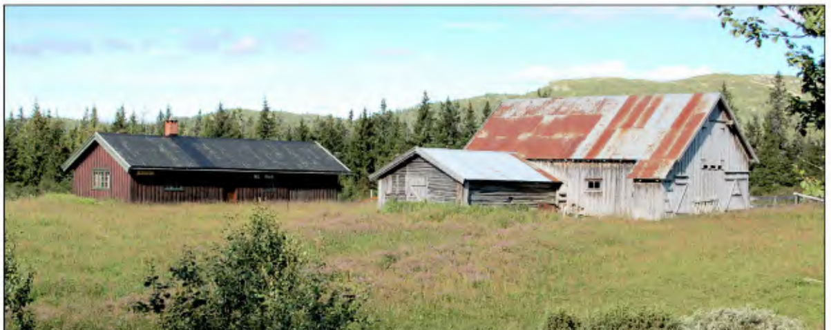
Gullringen er en av setrene i Fåberg Vestfjell.

Denne turen blir ikke annonsert i avisene.